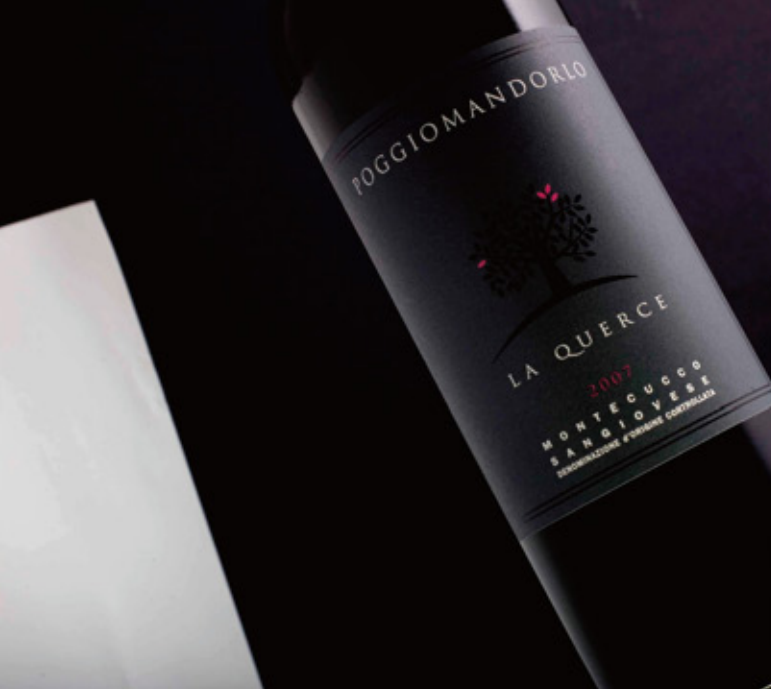
LA QUERCE ' 08