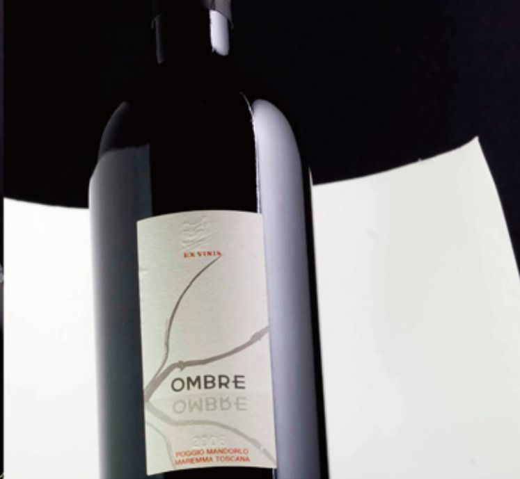
OMBRE ' 07