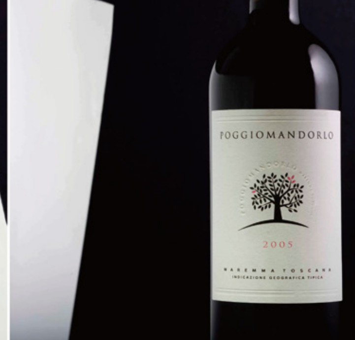
POGGIO MANDORLO ' 06